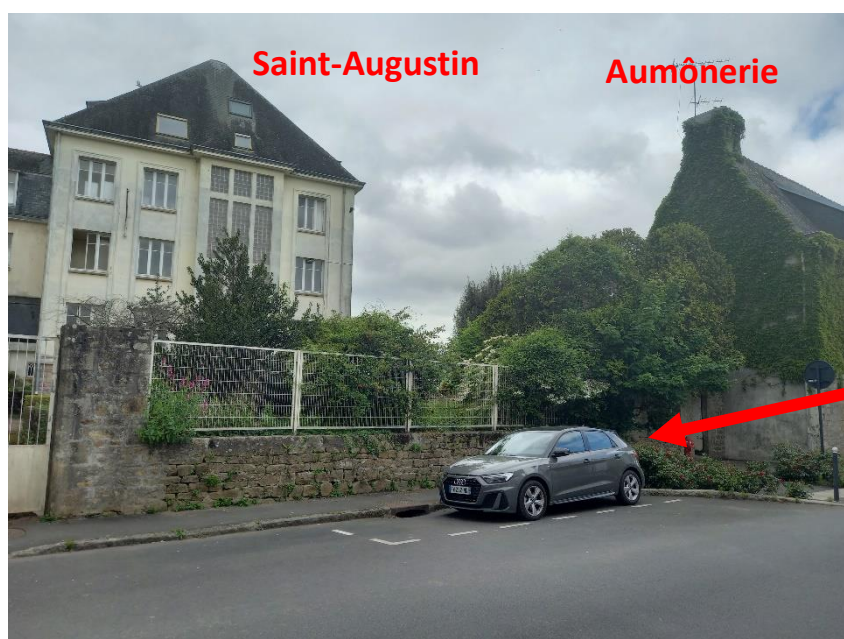
Porte d'accès au site de l'Hôtel-Dieu.

Il existe également une petite porte en bois permettant d'accéder au reste du site de l'Hôtel-Dieu. Cependant la porte n'étant pas visible, il est difficile de parler d'un accès véritable.