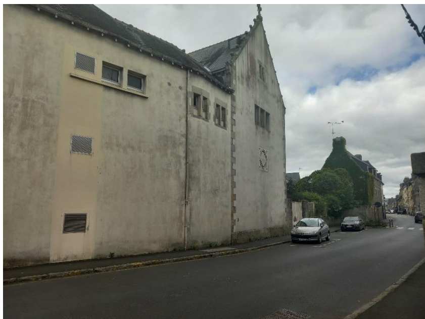
Façade rue Général de Gaulle bâtiment Saint-Anne

Situé le long de la rue du Général de Gaulle, l'implantation des bâtiments offre une vue esthétique et urbanistique peu appréciable sur la ville. En effet le bâtiment Saint-Anne s'implante le long de la rue via une façade aveugle.