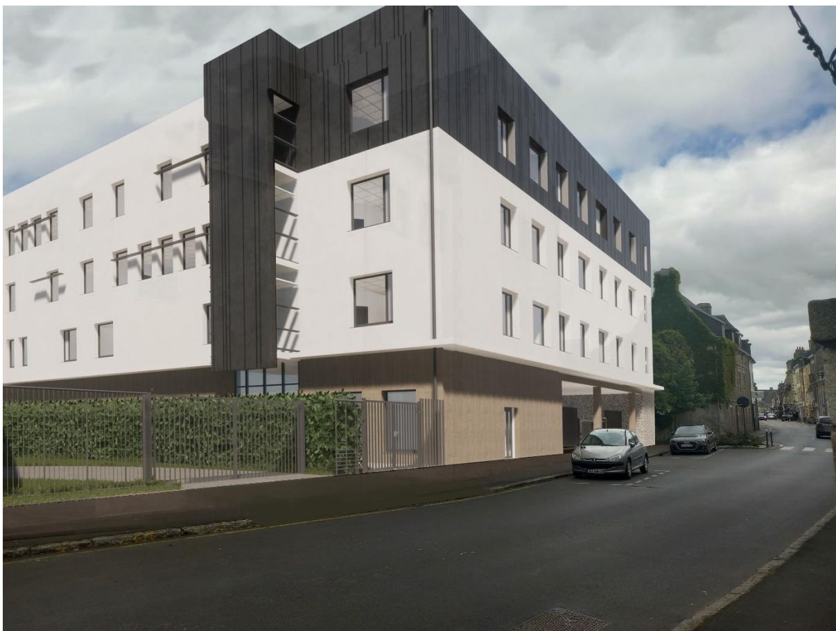
Insertion bâtiment du pôle psychiatrie le long de la rue du Général de Gaulle.