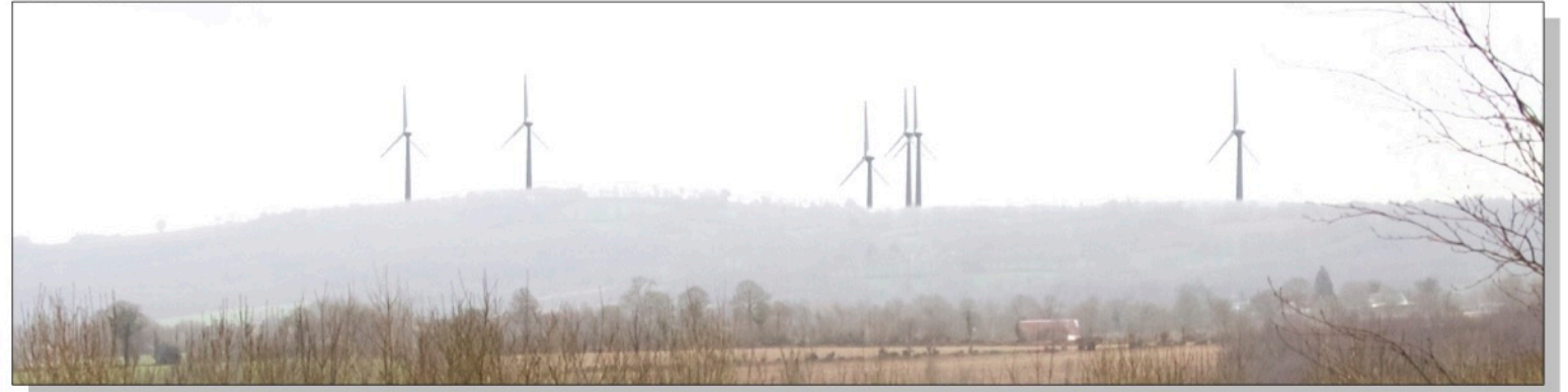
Zoom sur éoliennes