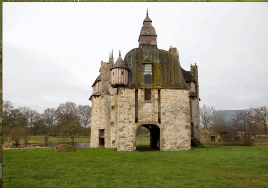
vue de la Saucerie, porte monumentale du XVI e siècle