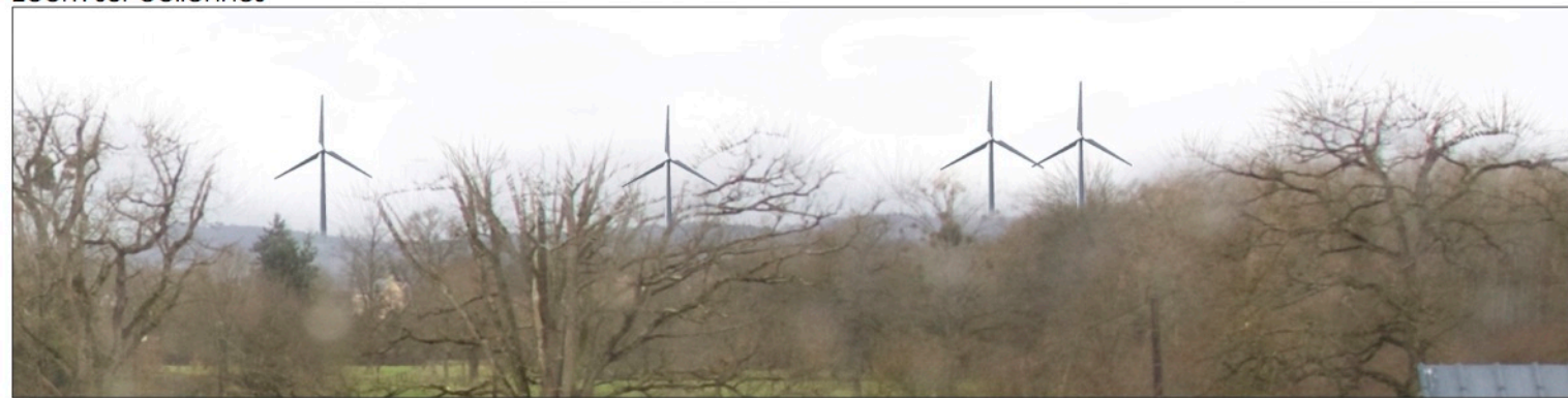
Zoom sur éoliennes