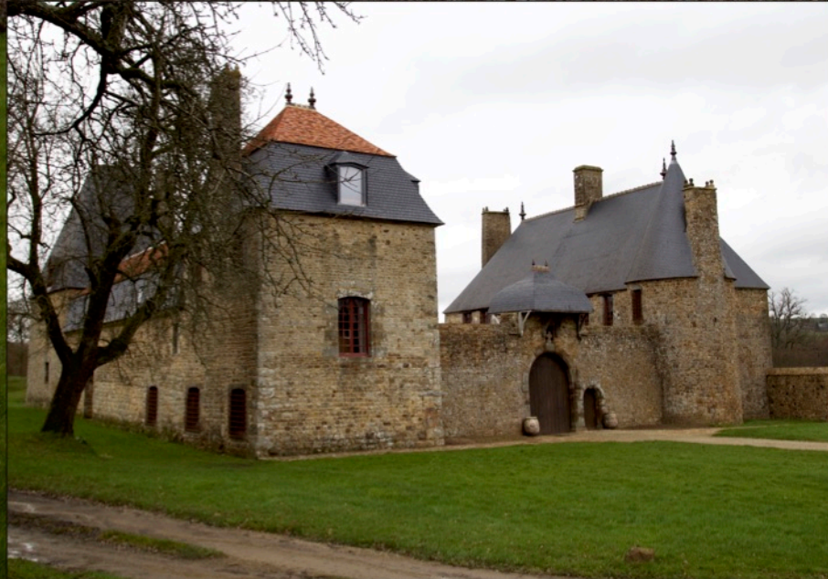
Vue du Manoir de la Chaslerie