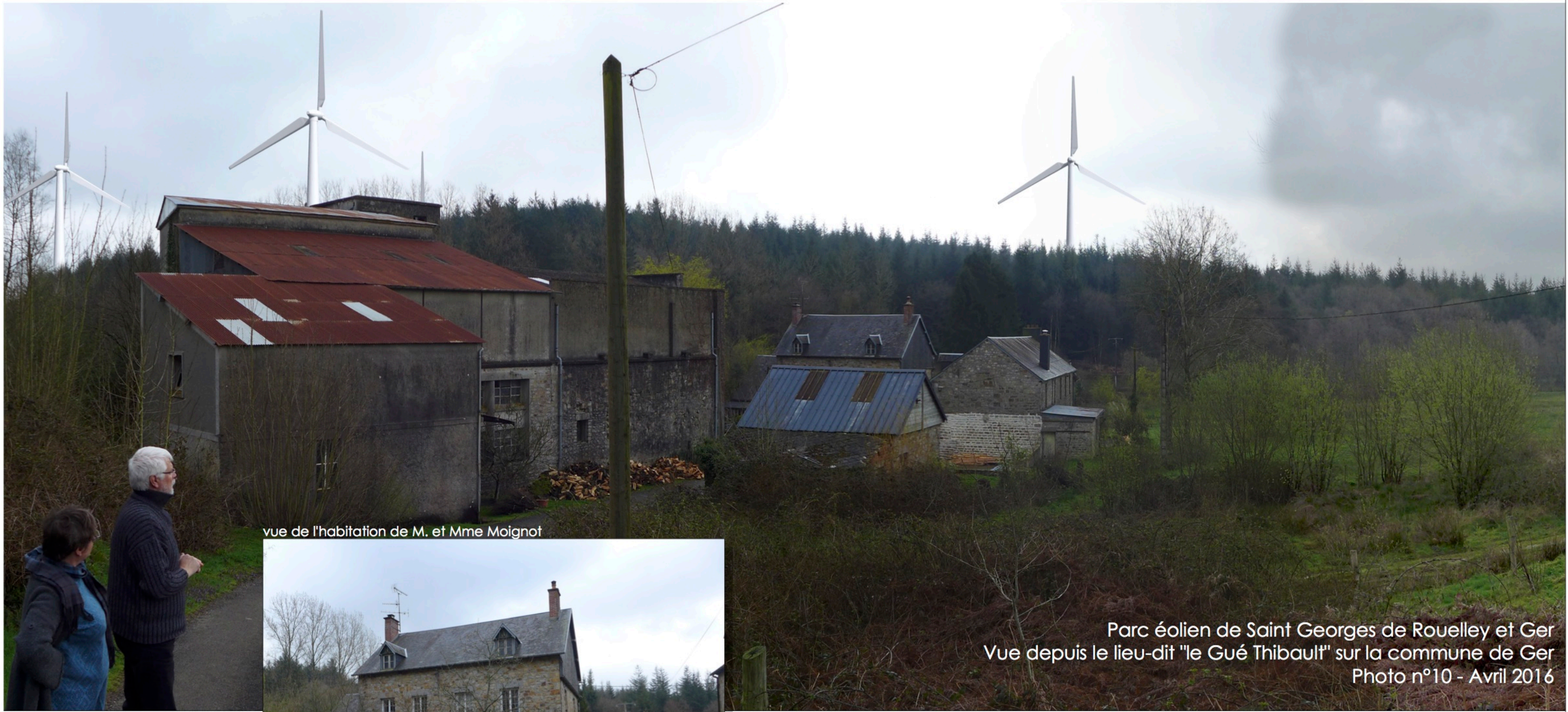
vue de l'habitation de M. et Mme Moignot