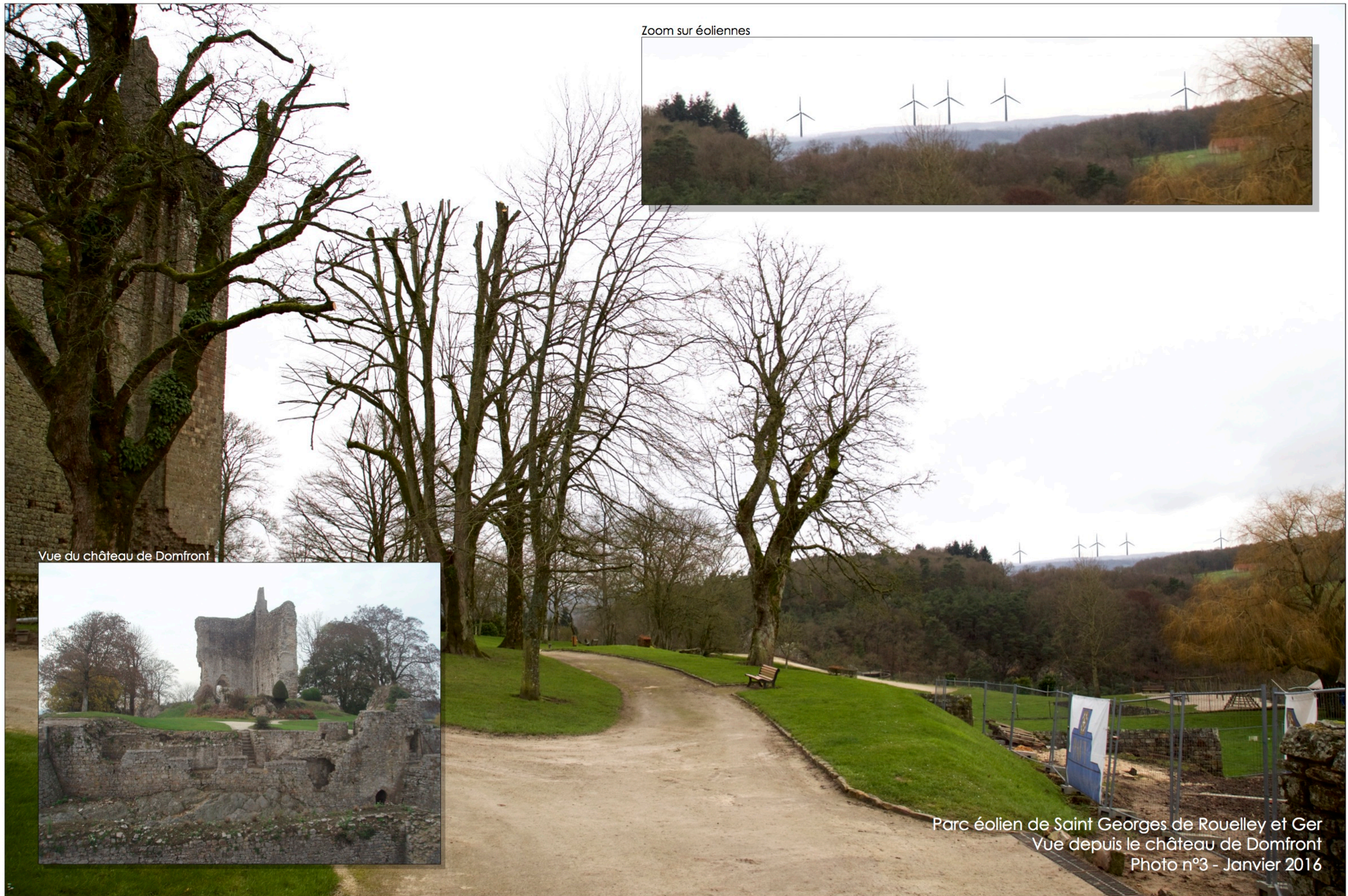
Zoom sur éoliennes