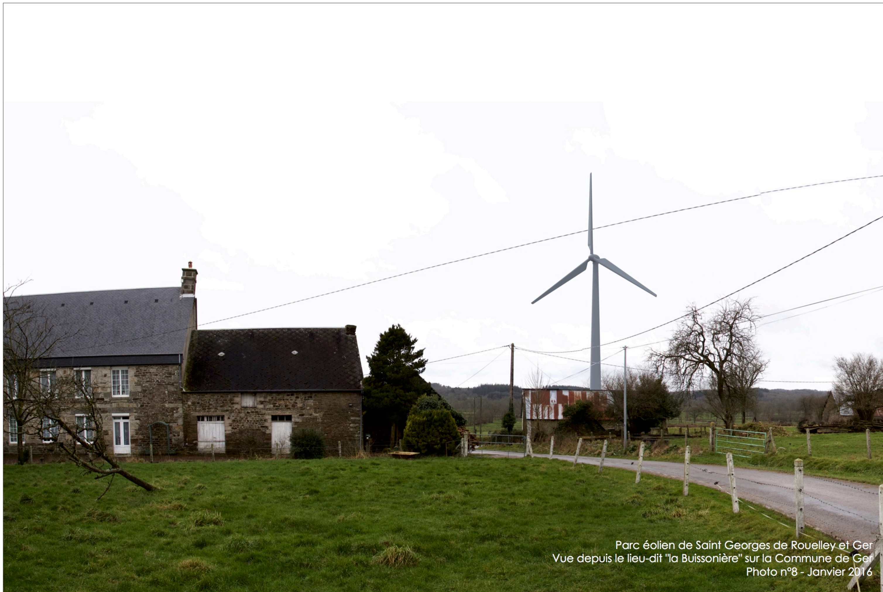
Parc éolien de Saint Georges de Rouelley et Ger Vue depuis le lieu-dit "la Buissonière" sur la Commune de Ger Photo n°8 - Janvier 2016

Altitude NGF : 259m / Distance à l'éolienne la plus proche : 700m