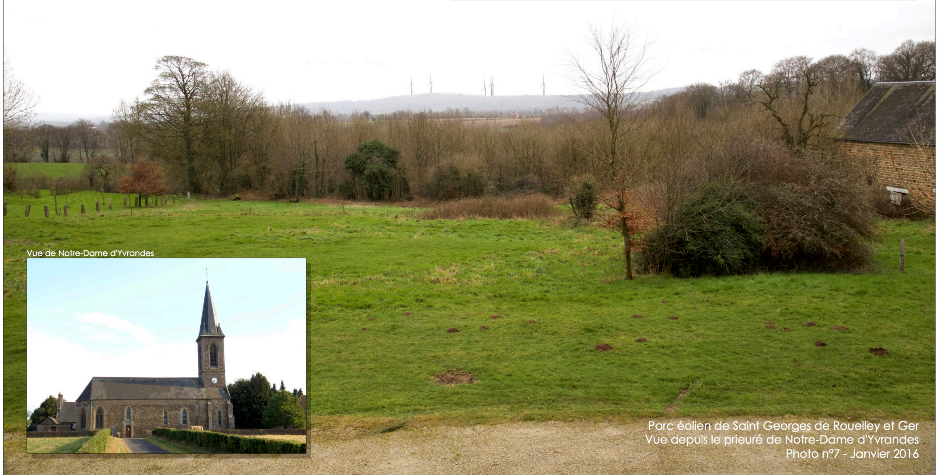
Vue de Notre-Dame d'Yvrandes