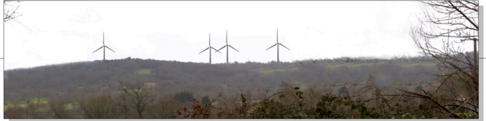
Zoom sur éoliennes