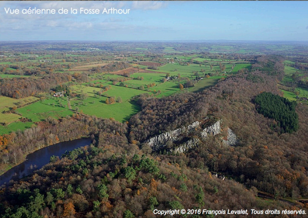
Vue aérienne de la Fosse Arthour