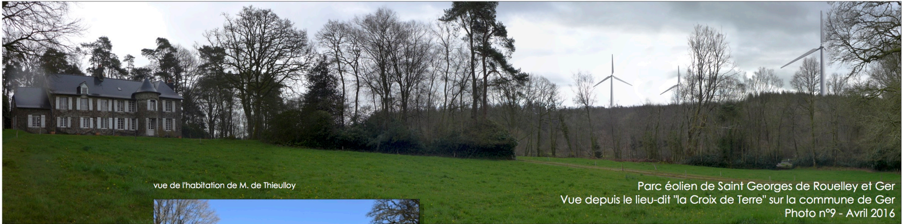
vue de l'habitation de M. de Thieulloy