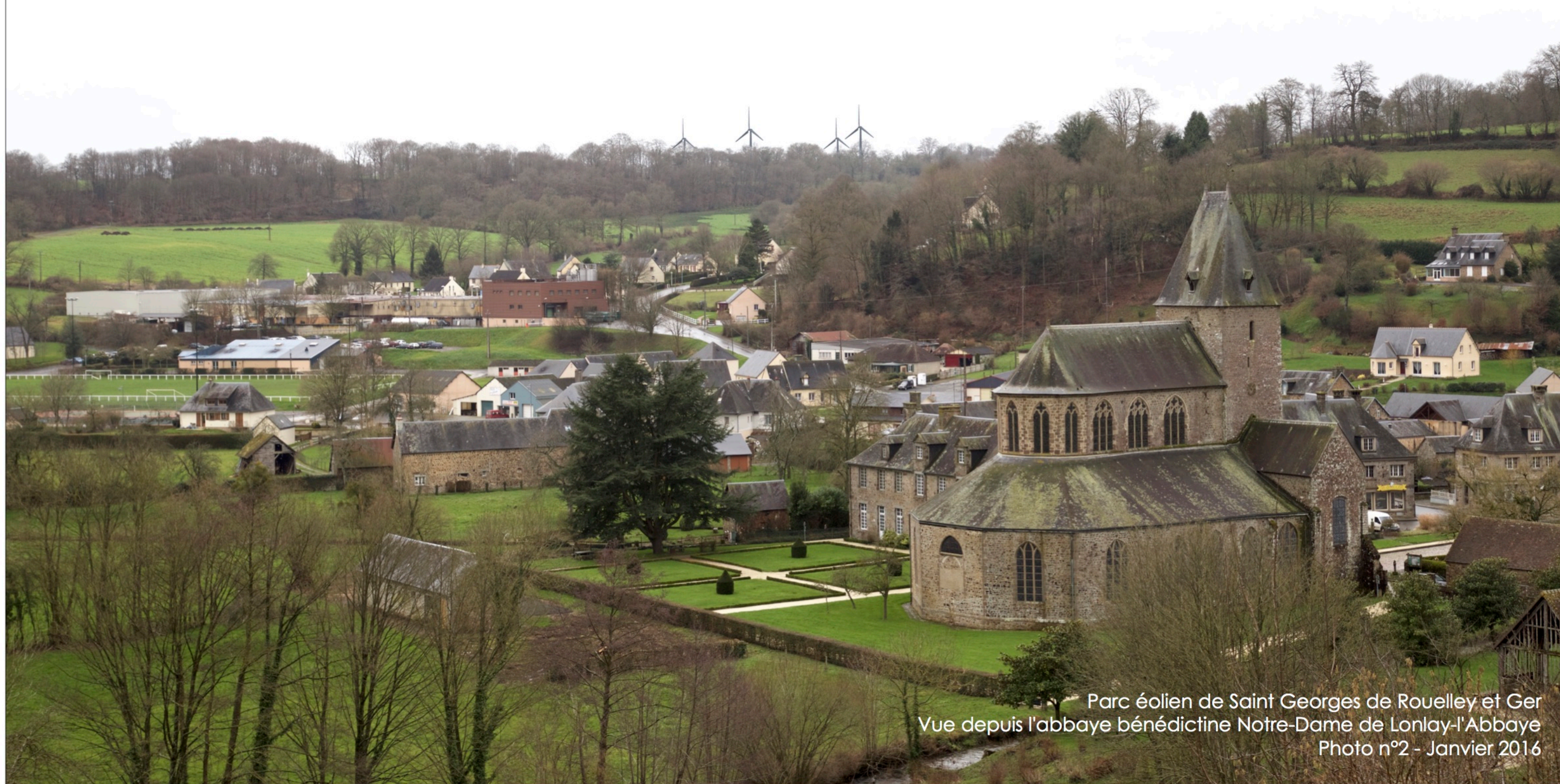
Parc éolien de Saint Georges de Rouelley et Ger Vue depuis l'abbaye bénédictine Notre-Dame de Lonlay-l'Abbaye Photo n°2 - Janvier 2016

Altitude NGF : 165m / Distance à l'éolienne la plus proche : 4,7 km