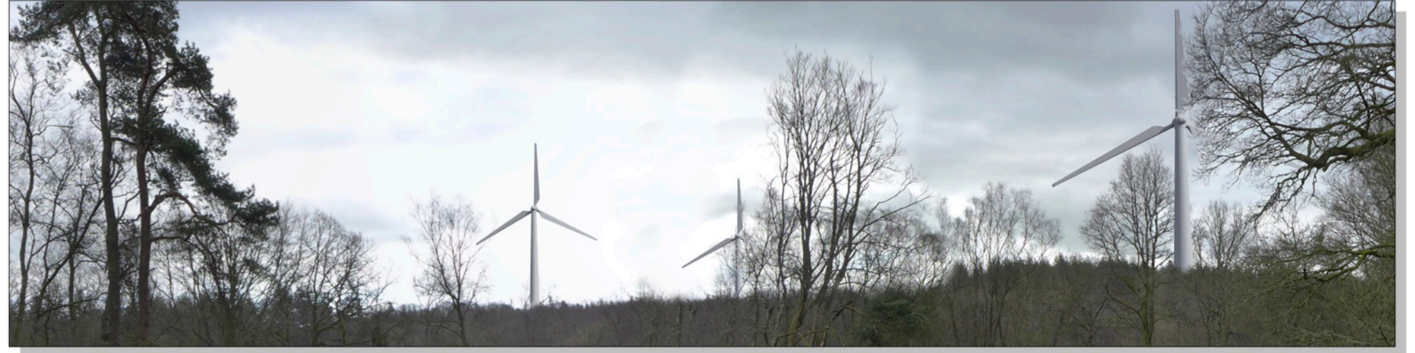
Zoom sur éoliennes