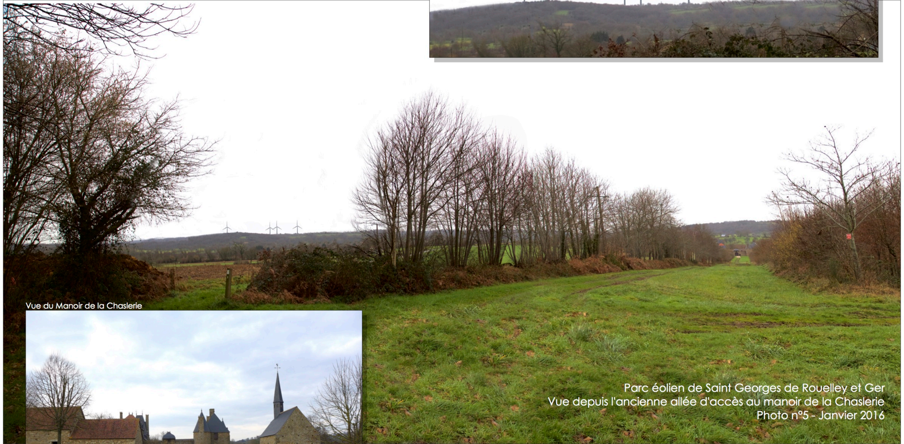
Vue du Manoir de la Chaslerie