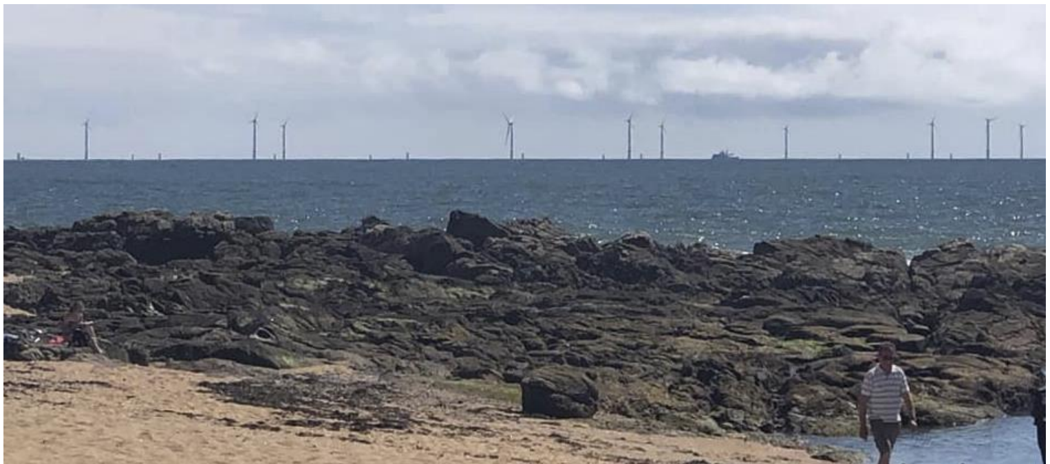
Parc éolien de Saint Nazaire (du banc de Guérande) en construction photographié depuis Batz-sur-Mer. La distance à la côte est ici d'environ 12 km. On distingue les socles des éoliennes restant à installer – Juillet 2022

Mme le maire de Pornichet : « À l'époque, on m'a toujours dit qu'elles seraient de la taille d'une allumette. (...) Il y a des jours où (...), on a l'impression qu'elles sont juste en face de nous. (...) »