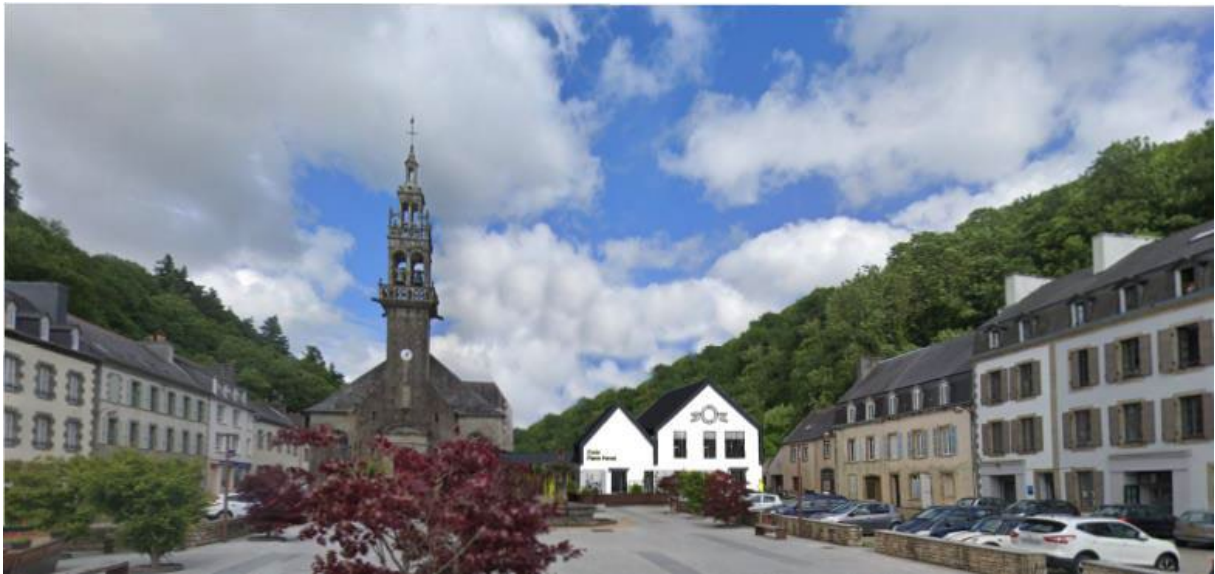
Projet de reconstruction de la mairie-école, Port-Launay, 2023